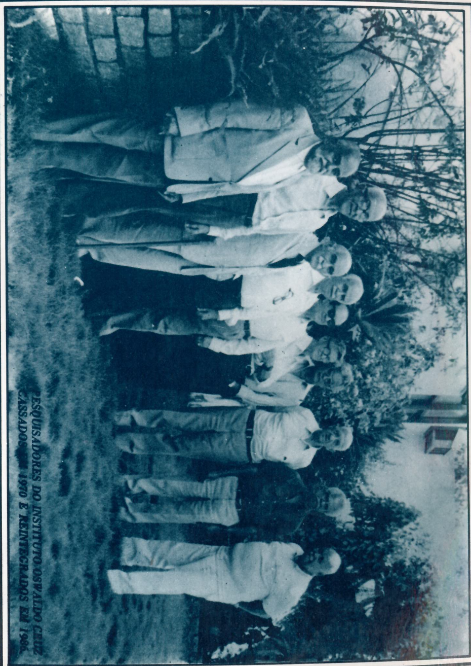
PESSOAL DO INSTITUTO OSWALDO CRUZ CASADOS EM 1970 E REINTEGRADOS EM 1968.